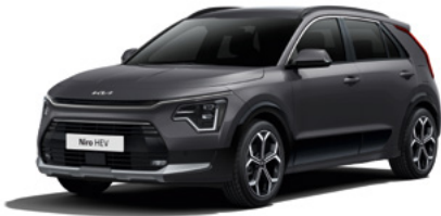
Interstellar Grau Metallic (AGT)