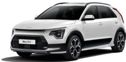
Snow White Pearl (SWP)