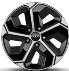
16-Zoll-Leichtmetallfelgen (Serie für Edition 7 und Vision)

Bei einigen unserer modernen Metallicfarben werden bewusst unterschiedliche Farbpigmente verwendet. Dadurch können unter bestimmten Lichtverhältnissen, z. B. direktes Sonnenlicht, attraktive Farbeffekte erzielt werden. Zum Teil kann die Farbe changieren, z. B. von Schwarz zu Dunkelblau. Bei den hier abgebildeten Farbdarstellungen kann es aufgrund der Drucktechnik zu Abweichungen zu den Originalfarben kommen. Weitere Informationen zu den Farbeffekten und Grundfarben erhältst du bei deinem Kia-Partner. Metalllackierungen sind aufpreispflichtig.