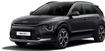
Auroraschwarz Metallic (ABP)