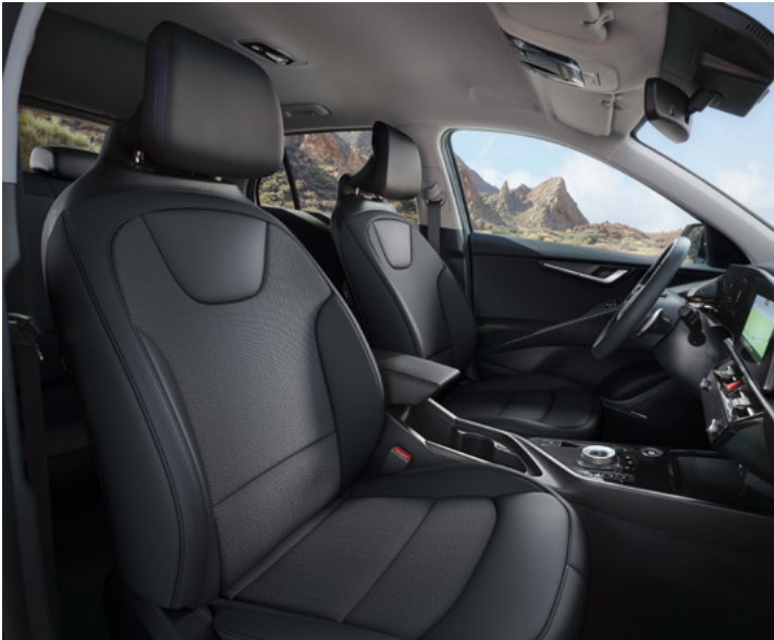
Sitzbezüge in Stoff-Leder-Kombination (mit hochwertiger Ledernachbildung), Charcoal (CCV) (Vision)