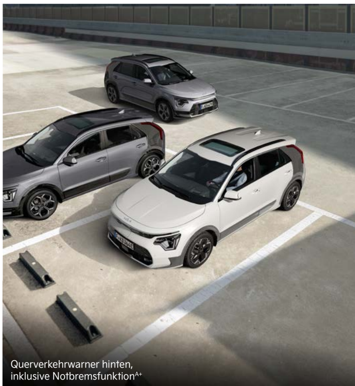
Querverkehrswarner hinten, inklusive Notbremsfunktion A+

Mit einem breiten Spektrum an aktiven Sicherheitssystemen A unterstützt dich der Kia Niro dabei, in Gefahrensituationen schnell und angemessen zu reagieren.