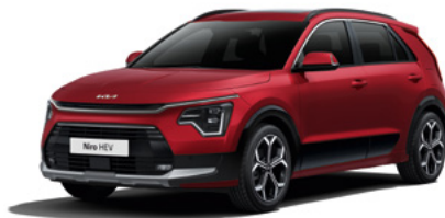
Runway Rot Metallic (CR5)

Bei einigen unserer modernen Metallicfarben werden bewusst unterschiedliche Farbpigmente verwendet. Dadurch können unter bestimmten Lichtverhältnissen, z. B. direktes Sonnenlicht, attraktive Farbeffekte erzielt werden. Zum Teil kann die Farbe changieren, z. B. von Schwarz zu Dunkelblau. Bei den hier abgebildeten Farbdarstellungen kann es aufgrund der Drucktechnik zu Abweichungen zu den Originalfarben kommen. Weitere Informationen zu den Farbeffekten und Grundfarben erhältst du bei deinem Kia-Partner. Metalllackierungen sind aufpreispflichtig.