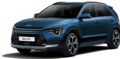
Mineralblau Metallic (M4B)