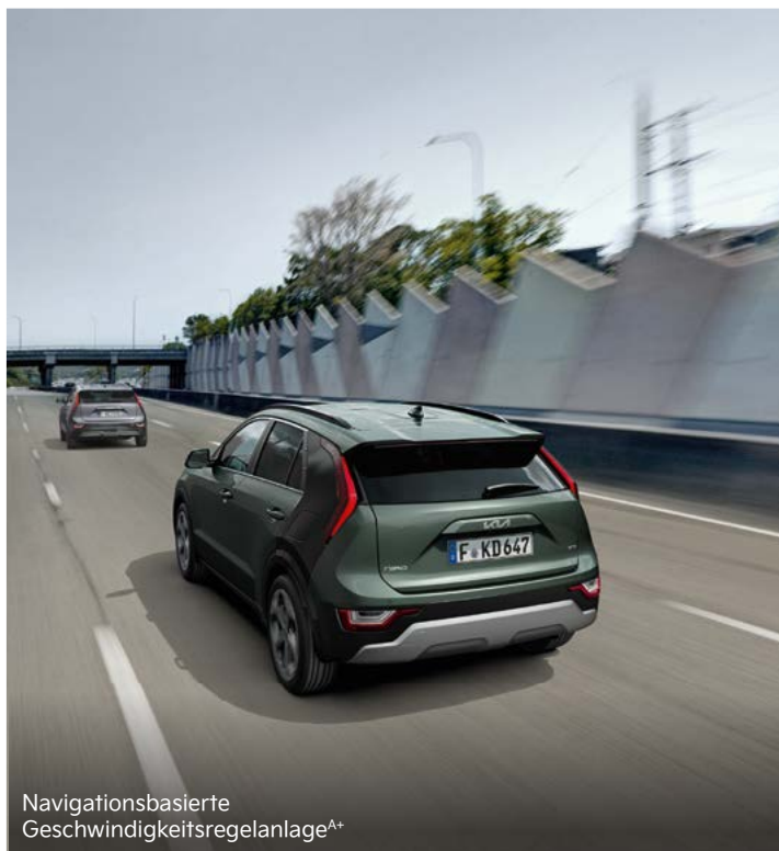
Navigationsbasierte Geschwindigkeitsregelanlage A+

Zusätzliche Sicherheit beim Zurücksetzen aus Parklücken oder langsamem Manövrieren im Rückwärtsgang: Der Kollisionsvermeidungsassistent (Parking Collision-Avoidance Assist, PCA) registriert mit Unterstützung der Rückfahrkamera sowie der hinteren Ultraschallsensoren, ob sich Fußgänger